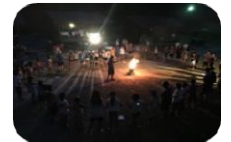
昨年度自然学校のようす